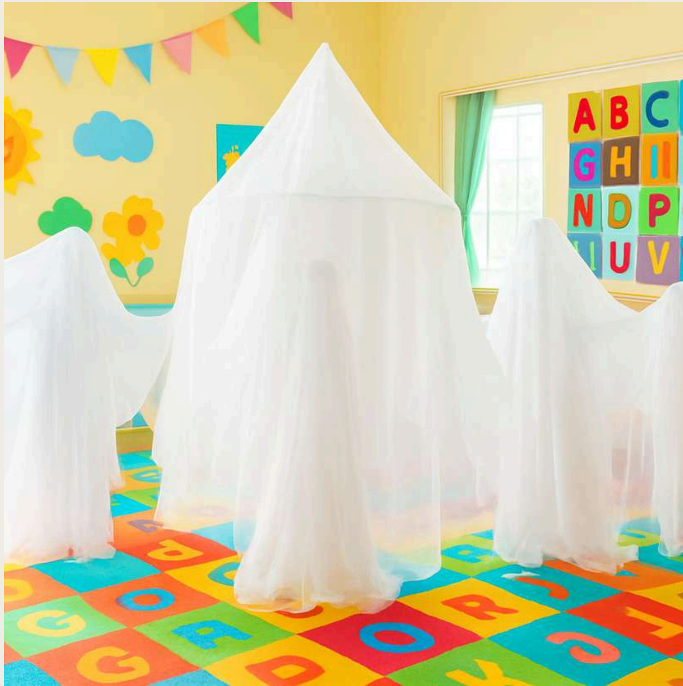
El espacio escénico

La escena son telas blancas ligeras, sujetas por tallos blancos , evocando un espacio etéreo y poético y creando un aire de misterio y anticipación. Toda la acción ocurre en este escenario.